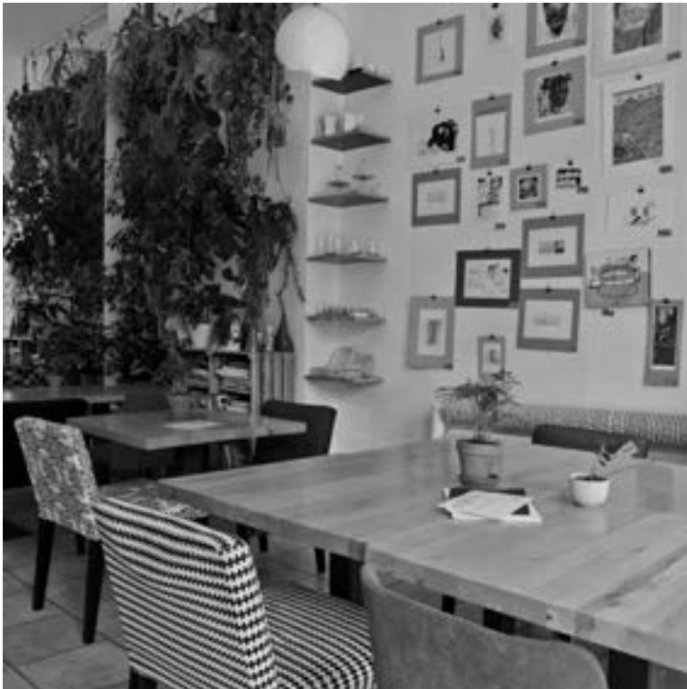
Food Think Tank kolektyw artystyczny | arte-kolektiboa Władysława Łokietka 6