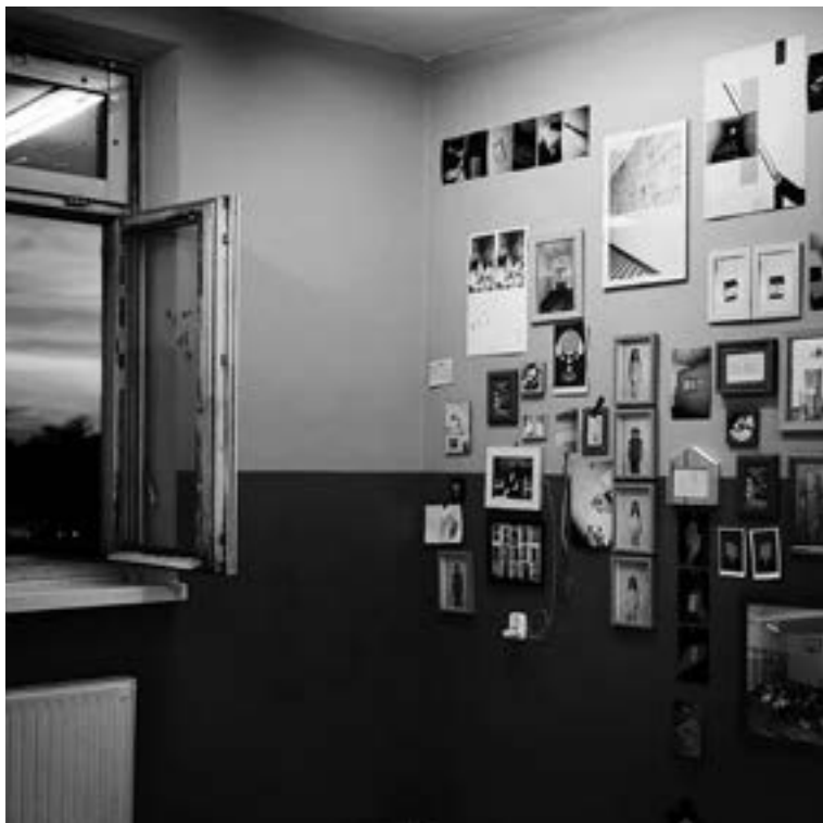
Galeria u Agatki niezależna galeria | galeria independentea Wyspa Tamka 2