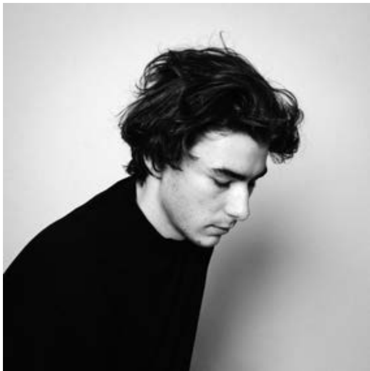
Jerzy Wypych fotograf | argazkilaria ZIN OŁBIN