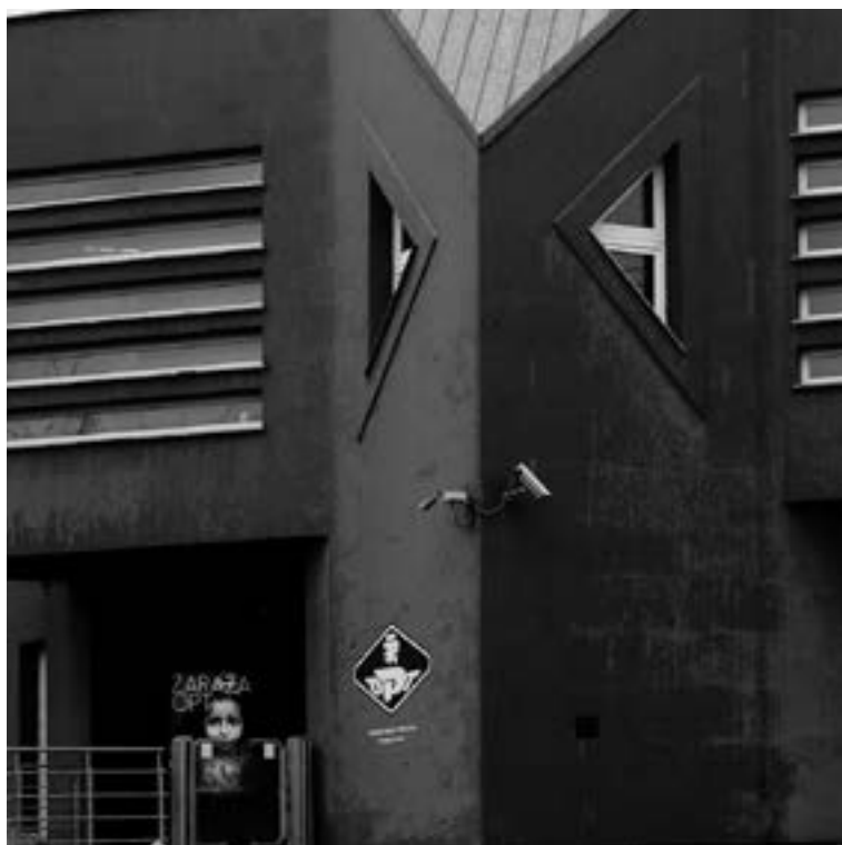
Ośrodek Postaw Twórczych miejska instytucja kultury | erakunde kultural herritarra Działkowa 15