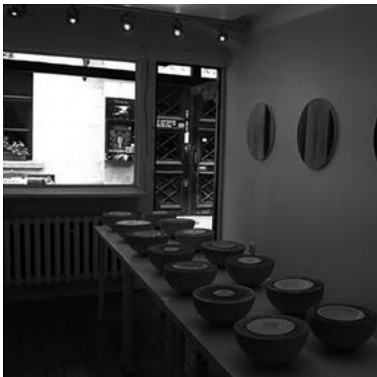
Tętno galeria sztuki i designu | arte eta diseinu galeria Jatki 12-13