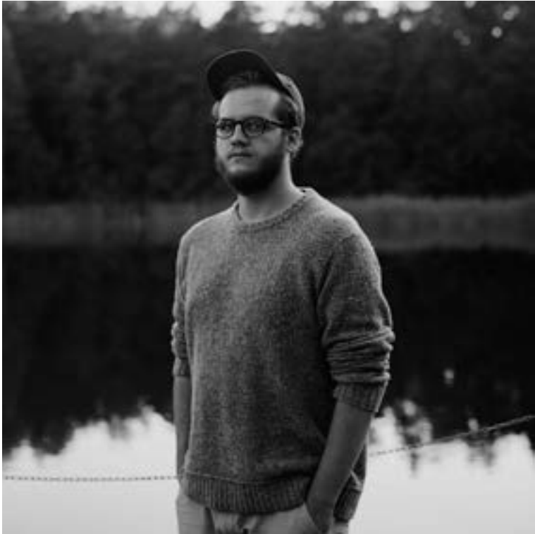
Paweł Starzec fotograf | argazkilaria