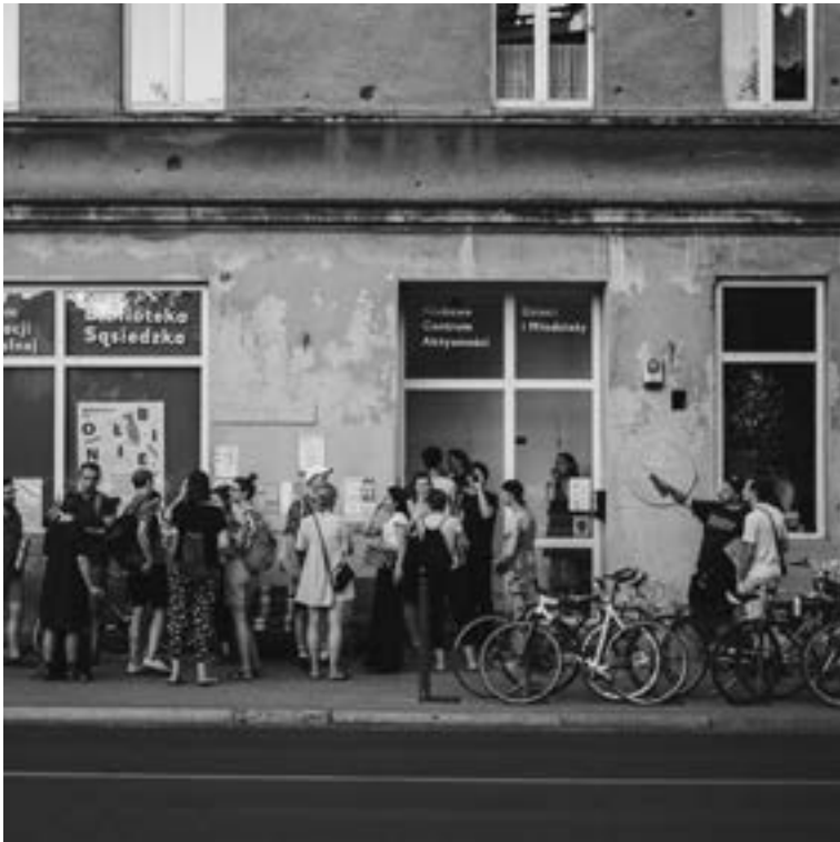
Stowarzyszenie Żółty Parasol ołbińskie centrum aktywności lokalnej Ołbin auzoko ekintza gunea Prusa 37-39