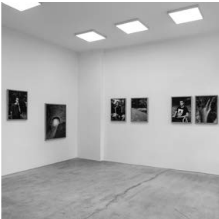
Miejsce przy Miejscu 14 galeria fotografii | argazki-galeria Plac Strzelecki 14