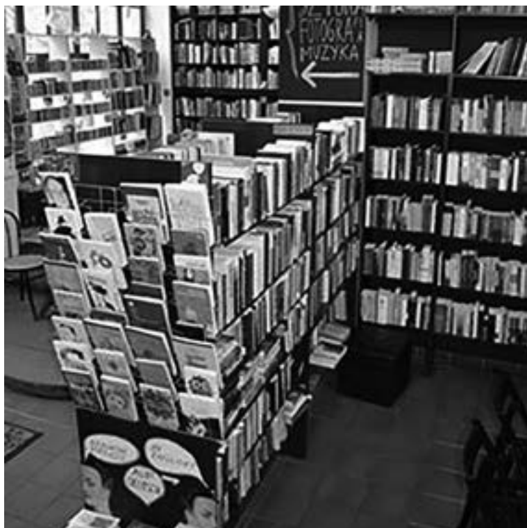
Tajne Komplety księgarnia | librudenda Przeście Garncarskie 2