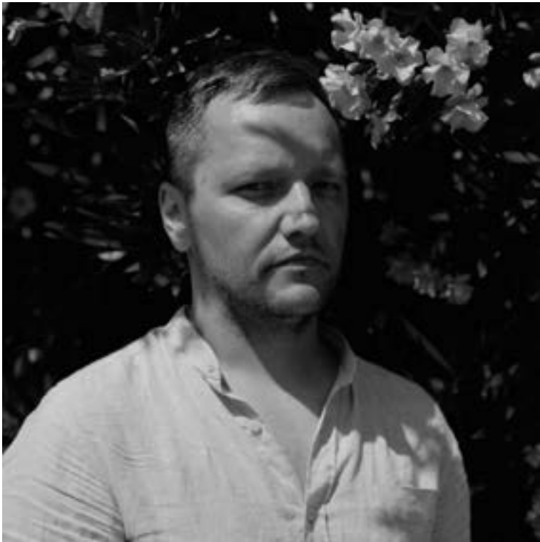
Łukasz Rusznica fotograf i kurator argazkilaria eta komisarioa