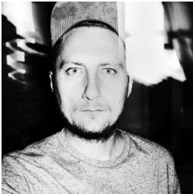
Krzysiek Orłowski fotograf i wydawca | argazkilaria eta editorea 89/91 publishing