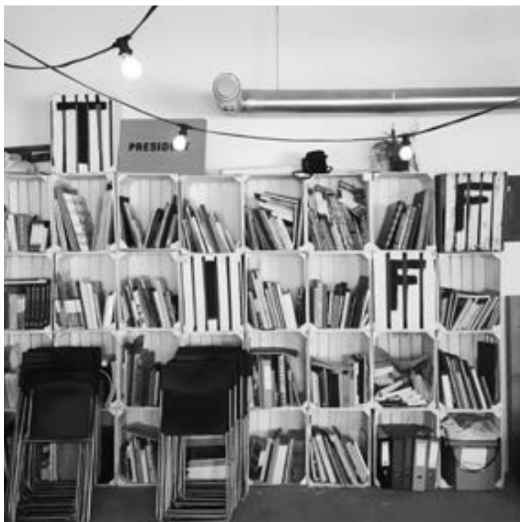
TIFF Center przestrzeń fotograficzna i biblioteka argazki-espazioa eta liburutegia Ruska 46A, III p.