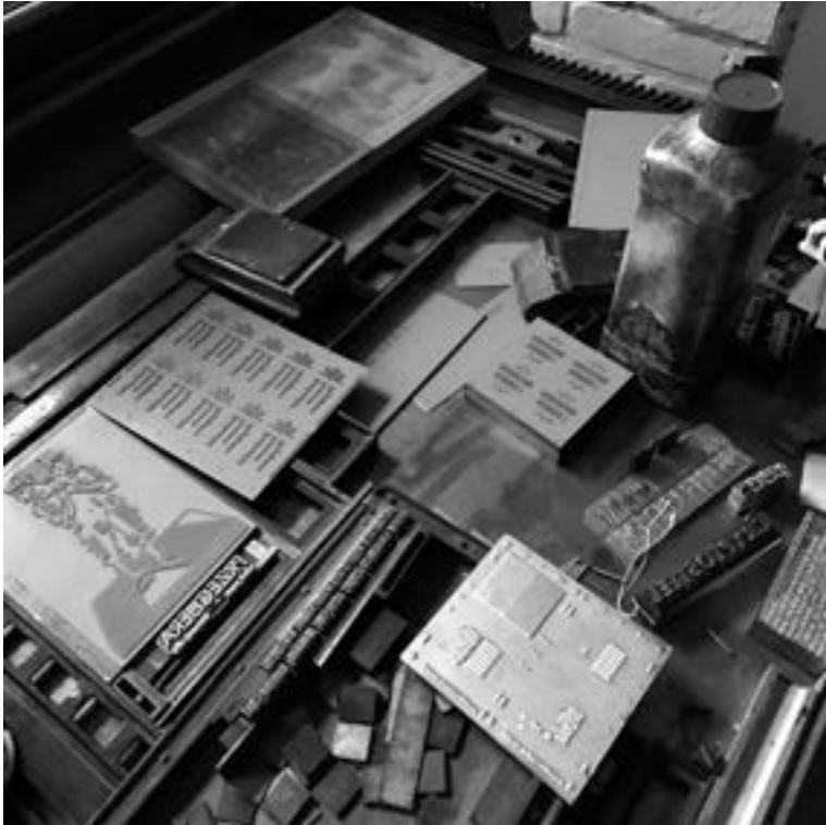
Mutant Letterpress studio graficzne i letterpress letterpress eta estudio grafikoa Plac Strzelecki 12